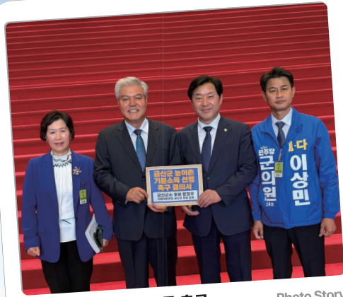
금산군 농어촌 기본소득 촉구 결의서 전달 및 요청