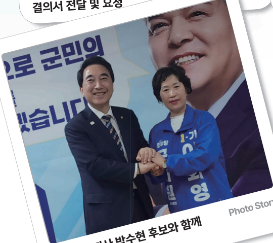
충청남도지사 박수현 후보와 함께