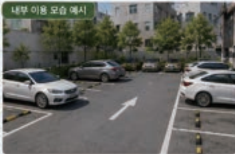
내부 이용 모습 예시