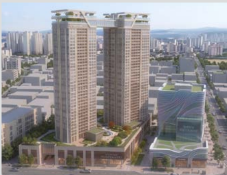
상남 복합스포츠타운 조감도(참고용 이미지)