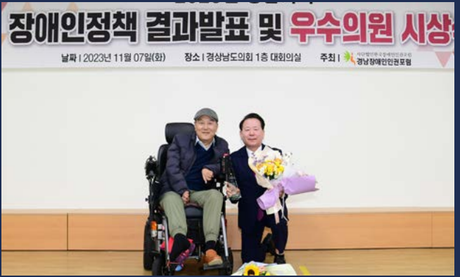
“한국매니페스토(부울경) 최우수의원 수상”