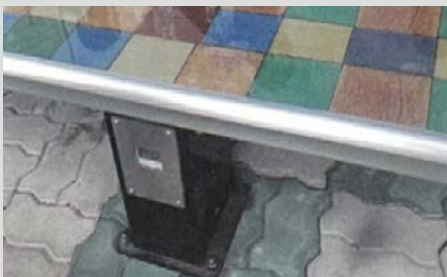
버스정류장 냉온열 의자