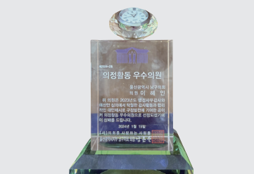
남구의회 의정활동 우수의원상 (2023년)