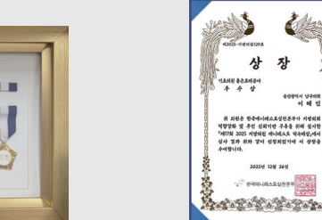
지방의원 매니페스토 약속대상 우수상 (2025년)