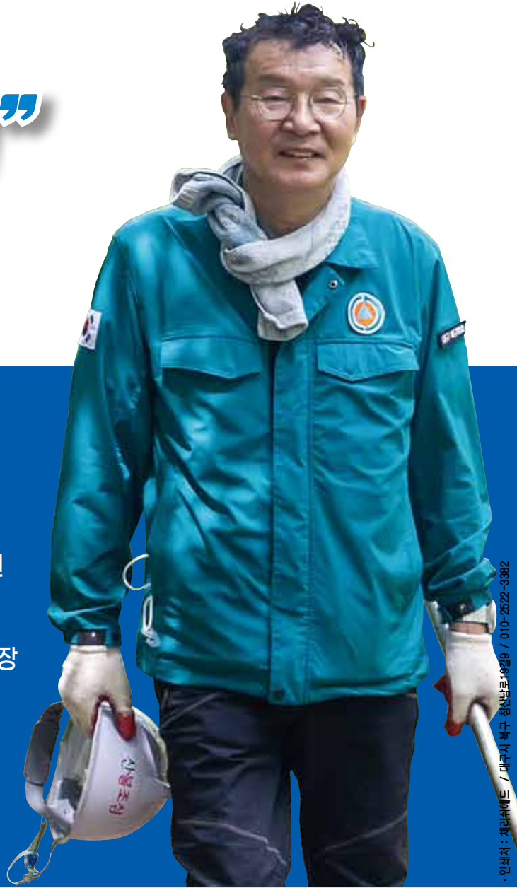
· 인쇄처 : 제리세이드 / 대구시 북구 침산로 199-9 / 010-2522-3382

매천초, 칠곡중, 영남고 계명대 사회학과(사회복지사) 계명대 정책대학원(행정학석사)