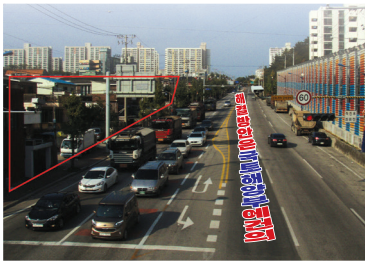
정상동 23통 방음벽 설치

정상동 23통 「 도로변 주민 민원해결 (삼척신문고) 」 건의 7번국도 차량 소음, 공해, 분진, 먼지로 인한 주차장확보 및 방음벽 설치 및 주거환경개선에 앞장선 삼척시민입니다.