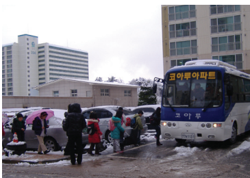
코아루 아파트 셔틀버스

관내아파트 「 셔틀버스 운행 」 법적 문제해결 코아루아파트 셔틀버스 운행 법적인 문제점을 해결한 그 당시 아파트 주민입니다. (코아루, 동부, 원당현대, 한양아파트 등 현재 운행중인 관내 아파트 셔틀버스 합법적 운행기반 마련)