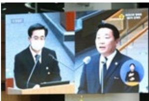
도 행정에 대한 도정질의