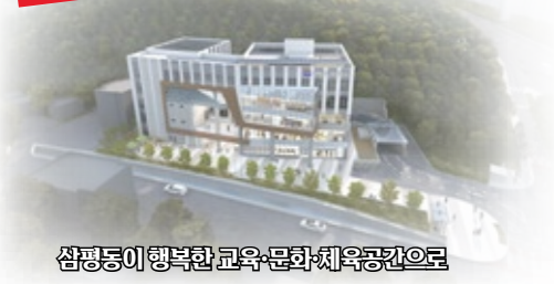
삼평동이 행복한 교육·문화·체육공간으로