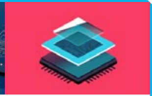
분당판교를 일자리 넘치는 한국형 실리콘밸리로