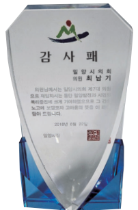
밀양 발전 시민 복지 감사패