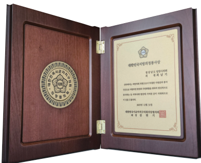
대한민국 지방의정 봉사상

아이 키우기 좋은 환경이 도시의 미래를 결정합니다. 교육과 돌봄 인프라를 확충해 부모와 아이 모두가 행복한 밀양을 만들겠습니다.