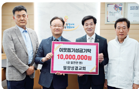
이웃돕기 성금 기탁 밀양 성결교회