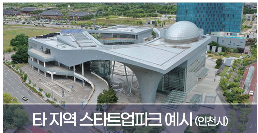
타지역 스타트업파크 예시 (인천시)