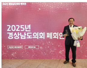
대한민국시도의회 의장협의회 제17회 우수 의정대상 수상