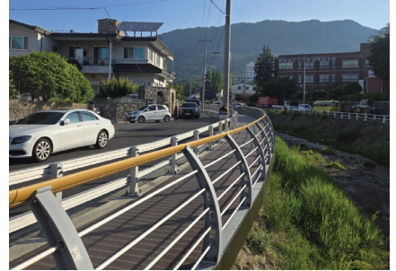
사림소하천 데크로드 설치공사