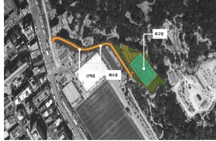
도계체육공원 정비 및 족구장 조성