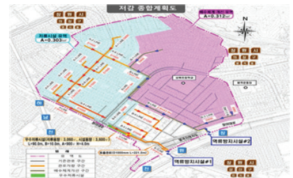
명서지구 우수저류시설 설치사업