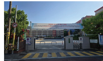
봉곡중학교 폐교 부지, 다시 주민의 품으로