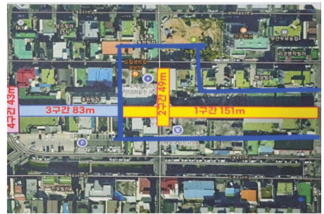
도계부부시장 쿨링존 설치