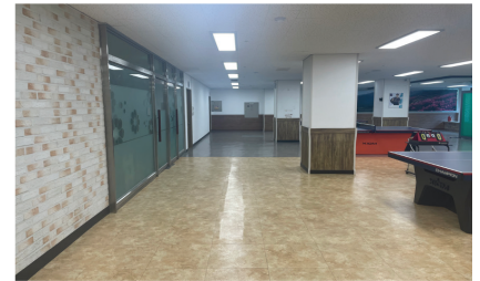
명곡동 주민자치센터 탁구장 환경개선 공사