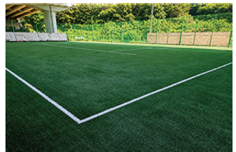
명곡동 족구장 인조잔디 설치 공사