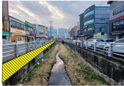
도계중 통학로 데크로드 조성