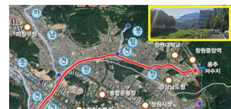
창원천 국가하천승격 기본계획수립 친수공간 조성 추진