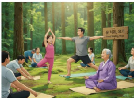
웰니스 치유 지도사 (AI 일러스트)