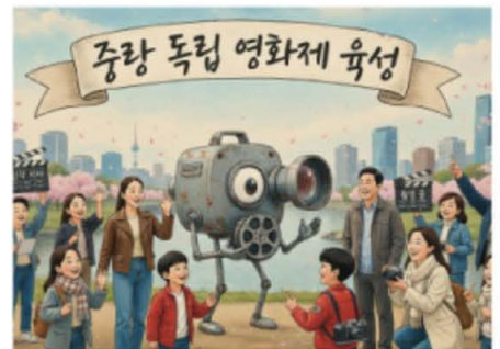
청소년 참여형 영화제 (AI일러스트)