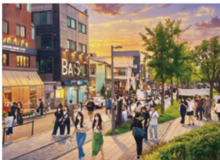
연남동 카페거리 (AI 일러스트)