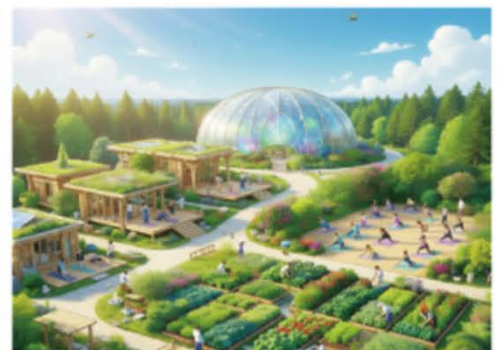
봉화산 웰니스 거점 (AI 일러스트)