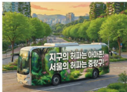
친환경 도시 중랑구 (AI 일러스트)