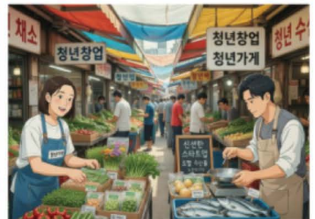
청년창업 통합지원 (AI 일러스트)