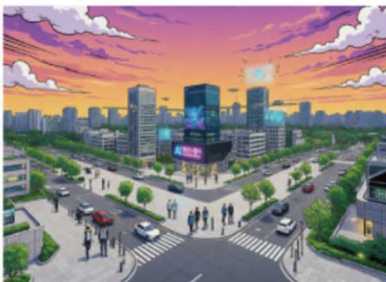
신내 AI 테크노벨리 (AI 일러스트)