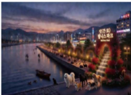
팻 웰니스 파크 (AI일러스트)