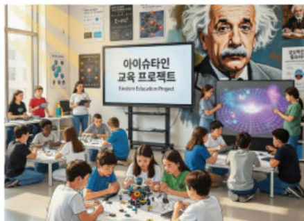
아이 + 슈타인 프로젝트 (AI 일러스트)