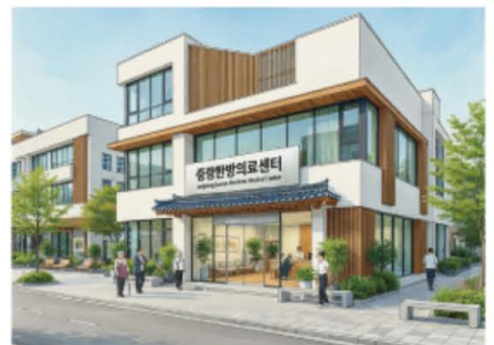
공공한방병원 (AI 일러스트)