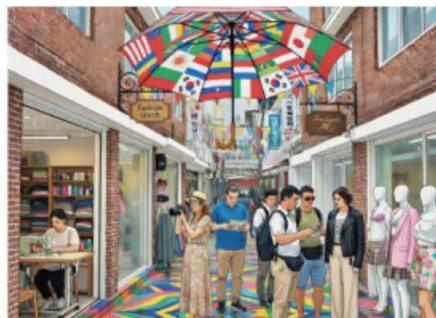
패션봉제 거리 관광벨트 (AI 일러스트)