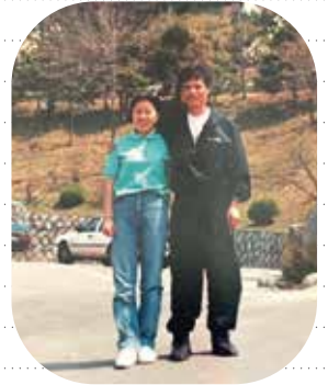
< 음성 꽃동네 천사의집 신혼여행 (3일간 봉사활동) 후 >