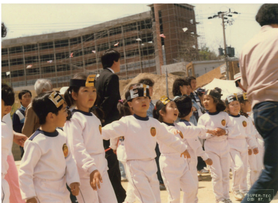
87년, 만5세, 홍신유치원 운동회