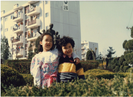
86년, 만4세, 친누나와 함께 주공시범에서