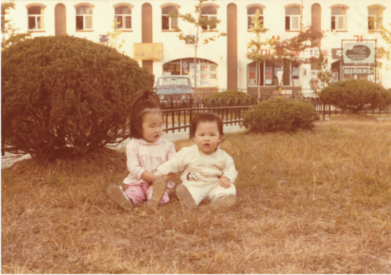
82년, 만1세, 친누나와 함께 제2주공에서