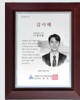
감사패 사단법인 한국지체장애인협회