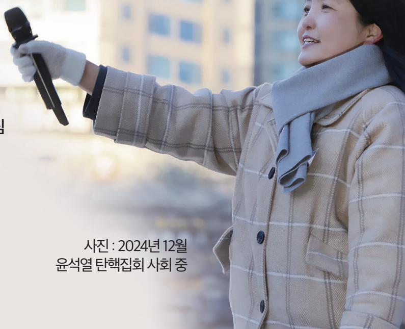
사진 : 2024년 12월 윤석열 탄핵집회 사회 중