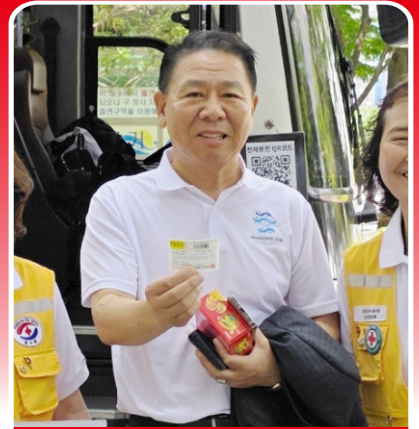
현혈 136회 실시