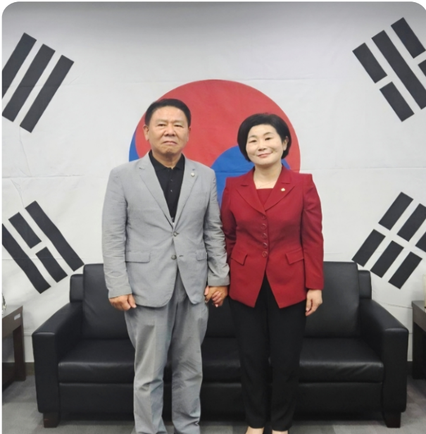
김희정 국회의원님과 국회에서