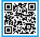
목동선·강북횡단선 촉구 시정질문 영상