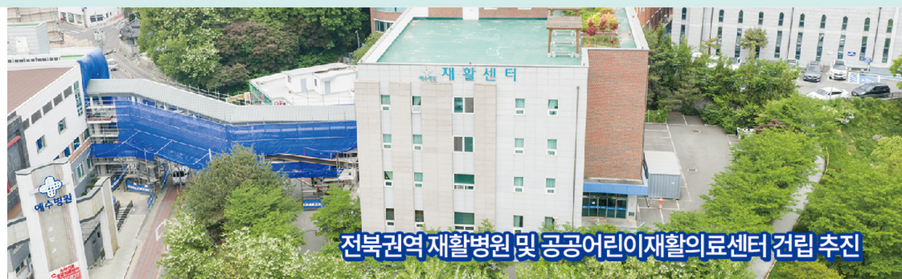
전북권역 재활병원 및 공공어린이재활의료센터 건립 추진