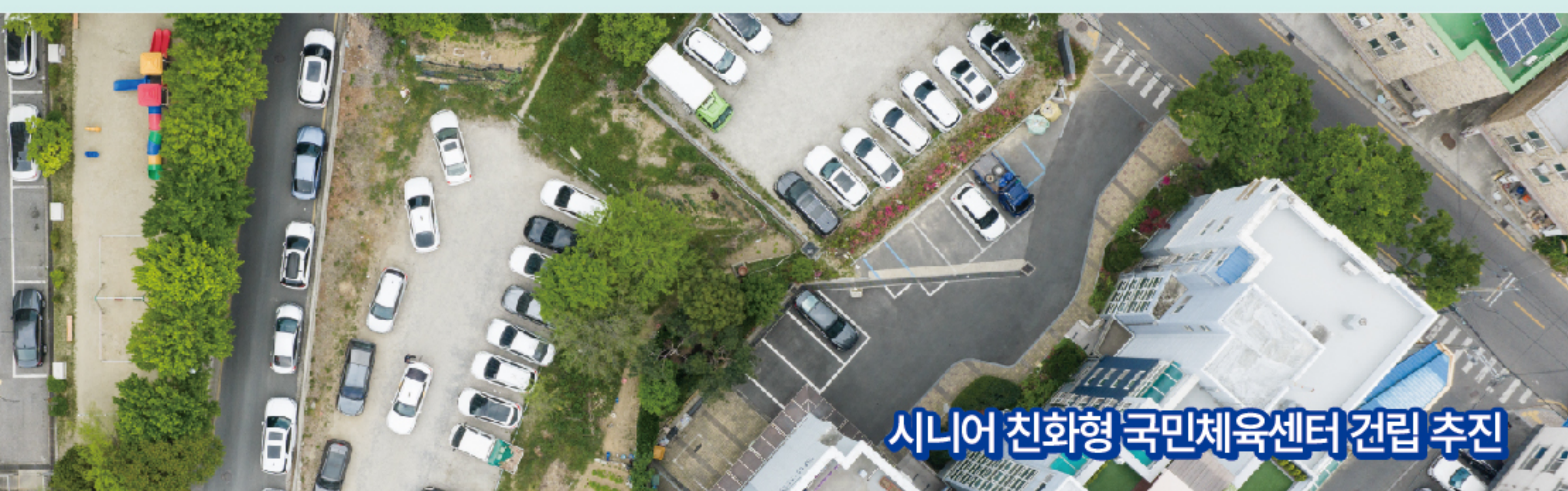
시니어 친화형 국민체육센터 건립 추진