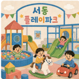
5. 익산 어린이들을 위한 ‘서동 플레이파크’ 건립