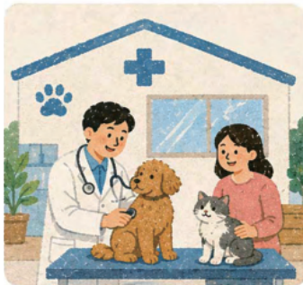
8. 반려인들을 위한 ‘익산시립반려동물병원’ 건립