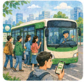
1. 무료로 빠르고 스마트하게 ‘익산 OK버스’ 도입

“선거운동 기간에 익산시민들이 제안해주신 생활·체감형 시민 정책공약 입니다”