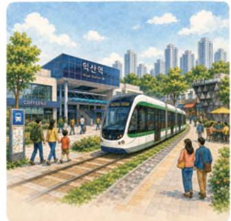
10. 역사와 현대가 공존하는 K-컬처로 익산역세권 개발명