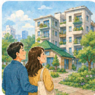
6. 청년 월세 5만원 주택, 신혼부부 월세 10만원 주택 지원