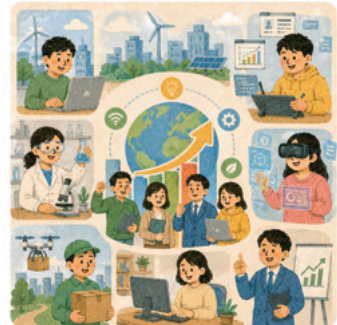
4. 미래형 워라밸 일자리·일거리 1,000개 창조