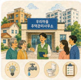
2. 단독주택을 관리해주는 ‘우리마을 관리사무소’ 설립