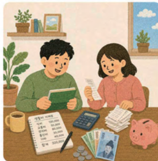
3. 생활비를 낮춰 드리는 월 ‘30만 원’ 살림패키지 제공