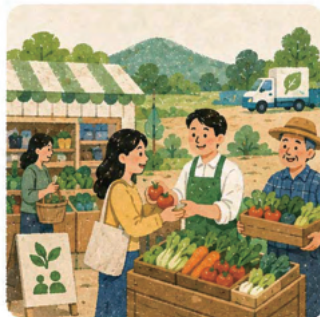
9. 농촌과 도시가 상생하는 로컬푸드직매장 확대