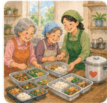
7. 어르신들을 위한 ‘효(孝) 도시락’ 부업