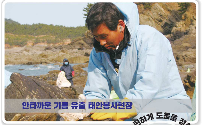
안타까운 기름 유출 대안봉사현장