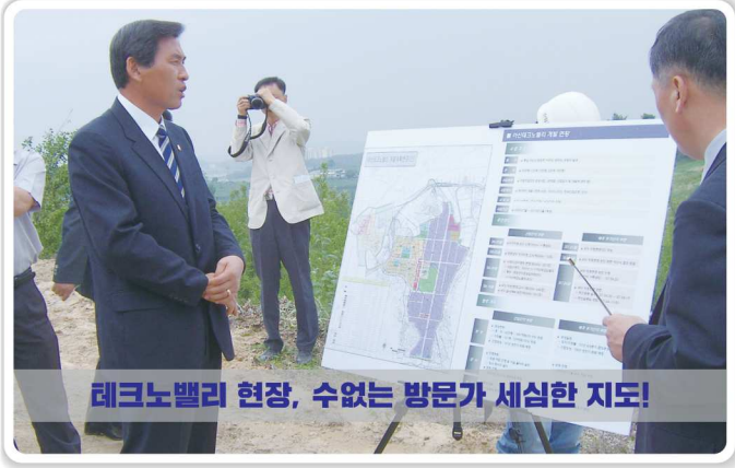
레코노밸리 현장, 수없는 방문가 세심한 지도!