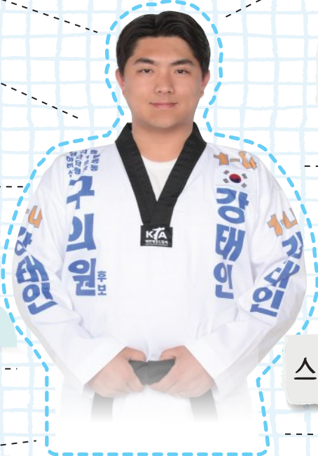
사하구 나선거구 구의원 선거투표