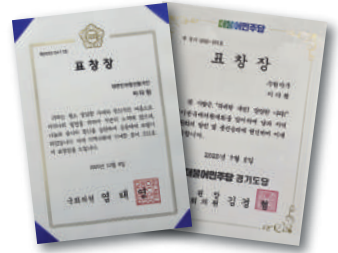
〈수상〉 2020 더불어민주당 1급 포상 2024 경기도의회의장상 2025 수원시장상 2025 더불어민주당 1급 포상