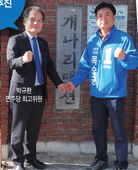
박규환 민주당 최고위원