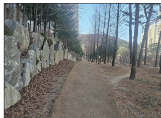
CCTV 및 안심벨 설치