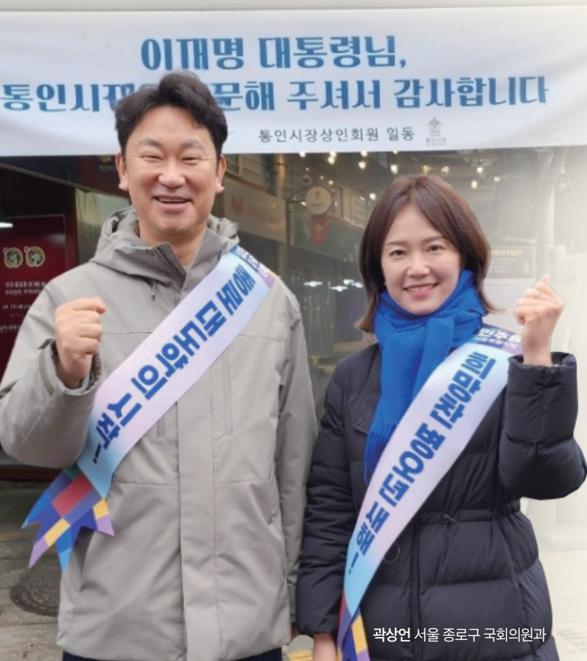
곽상언 서울 종로구 국회의원과