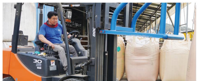
조사료 작업비 톤당 3천원 추가지급 완료

종자가격 43,000원 → 38,000원 어려운 영농 환경으로 경영위기에 놓인 농가 법씨 종자값 부담 완화