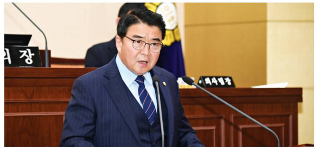
필수농자재 지원 조례 제정 (2025.06.27)

농약·비료·종자가격 급등시 최대 50% 지원 예측 불가능한 시장 변화에 대응, 농업인의 안정적인 생산 활동 지원