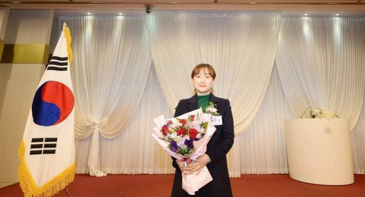
경기도시·군의회의장협의회 8회 의정활동 우수의원 시상식 2019. 5. 28.(화) 10:00 수원컨벤션센터