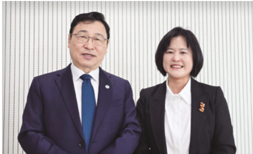
정근식교육감과 GTX-B 환기구 설치반대 학부모 주민 면담 성사

24시간 미세먼지·분진·화학오염 물질을 배출하여 아이들의 등하굣길 안전을 위협하는 GTX-B 환기구 설치. 단 한 번의 주민 설명회도 없이 일방적으로 추진하는 행정에 맞서고 있습니다. 정근식 교육감으로부터 ‘교육환경평가법 검토 지시’를 이끌어냈습니다. 그 실천력으로 우리 아이들의 건강권과 학습권을 끝까지 책임지고 지키겠습니다.