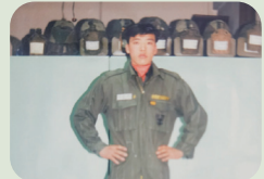
해군286기 복무기간 병장 만기전역 1986. 12. 11. ~ 1989. 11. 11.

대한민국을 수호하는 국군장병 모두에게 감사드립니다. 길거리 등에서 만나는 장병들께 따뜻한 박수와 격려를 보내는 전국민 캠페인을 제안합니다.