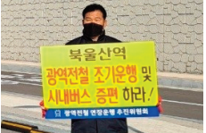
북울산역 개통시 광역전철 조기운행 및 버스 증편 피켓시위