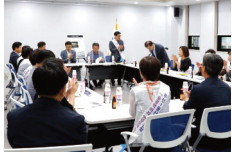
광역전철 연장운동 관련 정부관계부처와 회의