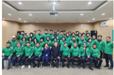
2026년 북구지역발전위원회 정기회의