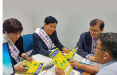
국민권익위원회의 광역전철 연장운동 당위성 설명