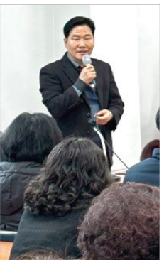
주민자치센터 프로그램 확장단간담회