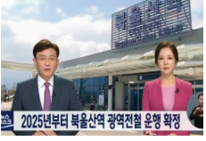
드디어 광역전철 연장운행이 확정되다