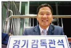
경기운영을 총괄 지휘하는 경기감독관