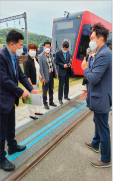
트램2호선 운행관련 활동