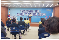
울산의료원 설립 범시민추진위원회 북구주민 대표로 활동