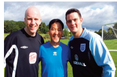
영국 프리미어리그 심판들과 함께