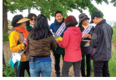
광역전철 연장운동 주민서명운동

북울산역 광역전철 추진위원회 위원장으로서, 12월 개통을 위한 송정역 연장운동을 주도하여 7만여명 주민들의 의견을 청와대에 전달하는 등 주민들의 불편을 해소하고 광역전철 추진을 위한 노력을 펼쳤습니다.