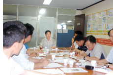
전국우리사주조합연합회 집행위원장 회의진행