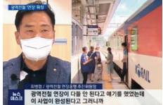
광역전철 연장운동 언론 인터뷰