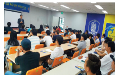
대한축구협회 신입심판 입문 격려사

“ 낮은 자세로 작은 목소리에도 귀 기울이고, 꼼꼼하게 하나하나 직접 챙기겠습니다. 언제나 주민편에 서서 함께하겠습니다. ”