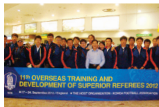
대한축구협회 엘리트심판 영국연수 총괄 단장