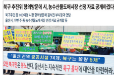
농수산물도매시장 선정 백지화 울산시장 형의집회