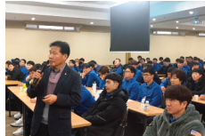
현대자동차 정규직 전환 신입사원 교육강의