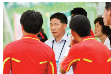
심판평정에 대한 조언을 해주는 모습