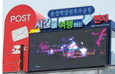
송정방산진호수공원 대형우체통·LED전광판 설치