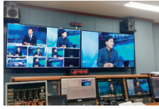
농수산물도매시장 북구유치 관련 방송출연