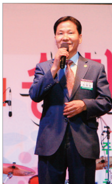
송화축제 발족 및 추진위원장