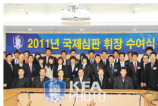
국제심판 회장 수여식