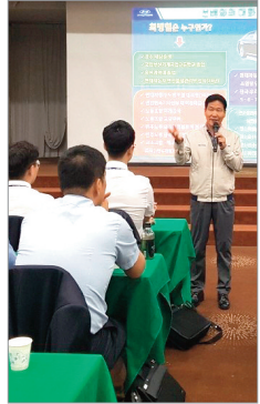
현대자동차 강부사원 교육강의