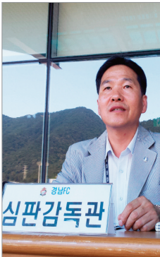
심판의 오심을 체크하는 심판 감독관