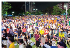
송화축제 및 주민총회 개최 (주민 3,500여명 참석)