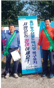
농수산물도매시장 북구유치 서명운동