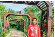
한솔공원 장미넝쿨 트램리스 설치