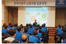
현대자동차 신입사원 입문과정