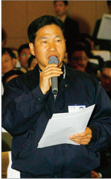
현대자동차 주주총회에서 무상주 지급요구 발언