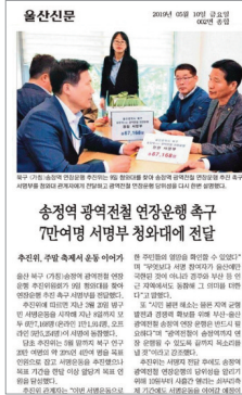
송정역 광역전철 연장운동 촉구 7만여명 서명부 청와대에 전달

북울산역 광역전철 추진위원회 위원장으로서, 12월 개통을 위한 송정역 연장운동을 주도하여 7만여명 주민들의 의견을 청와대에 전달하는 등 주민들의 불편을 해소하고 광역전철 추진을 위한 노력을 펼쳤습니다.