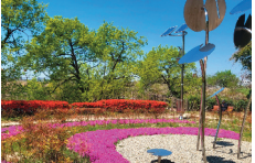
화동못수변공원 꽃단지 조성