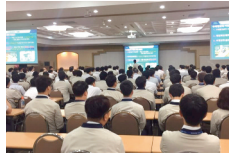
현대자동차 현강 강부사원 교육강의