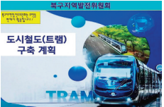
도시철도(트램) 구축 계획