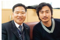
대한축구협회 홍보대사 「안정환」과 함께