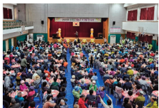
어르신 호사량 큰잔치 개최 (어르신 600여명 참석)