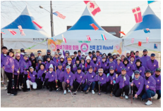
북구파크골프협회 클럽장 활동 (포바기)