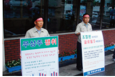
무상주 정책을 위한 출근시간 홍보투쟁