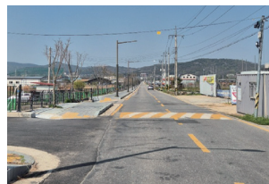
난전들로 도로 확장 및 인도 정비 (평화 2동)