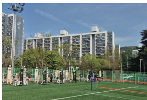
남부권 체육센터 조성 (평화 1동)

수 많은 민원을 한치의 소홀함 없이 늘 낮은자세로 확실하게 민원을 해결했습니다!