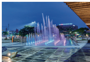
서학광장 분수대 설치 (서서학동)