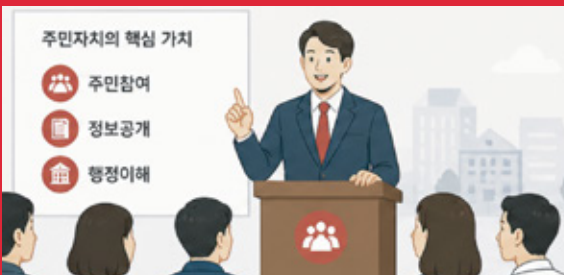
주민자치 기반 행정 이해도 확보