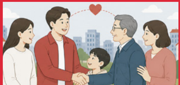
당과 지역을 연결하는 실무 경험