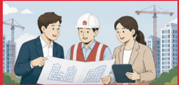
재개발·재건축 갈등 조정 경험