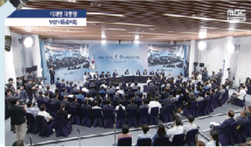
▲ 부산타운홀미팅 참석 이재명대통령과