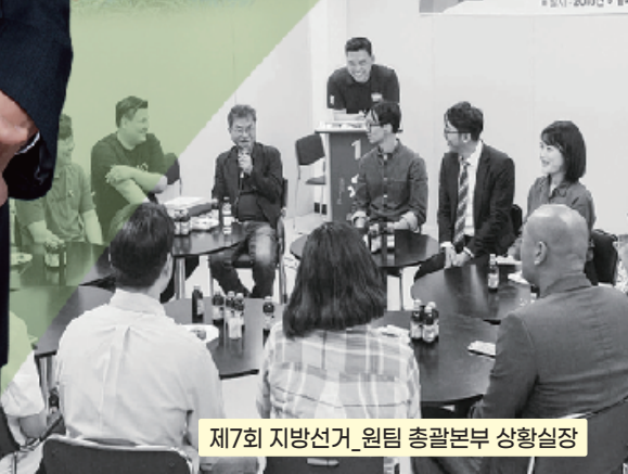
제7회 지방선거 원팀 총괄본부 상황실장