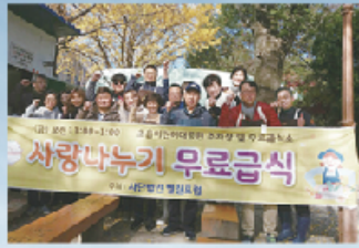
▲ 무료급식 - 초음 어린이대공원 - 북구 적십자나눔의집