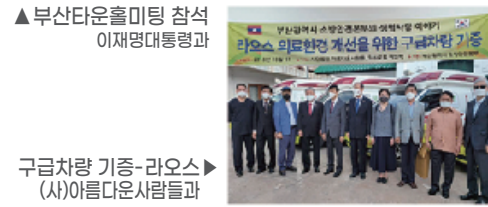
구급차량 기증-라오스 (사)아름다운사람들과