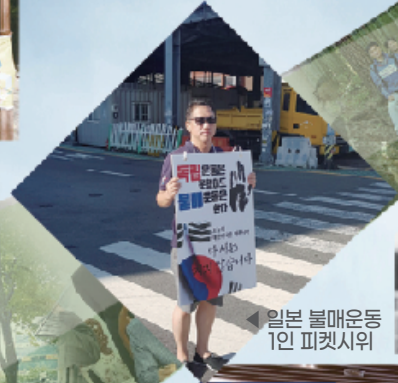
일본 불매운동 1인 피켓시위