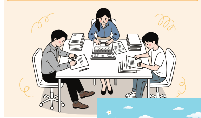
청년 창업 지원