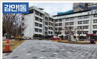
감만복지관 비포장 노면정리