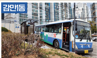
10번, 101번 버스노선 연장