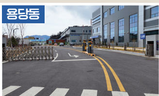
용당세관 주변 도시 정비