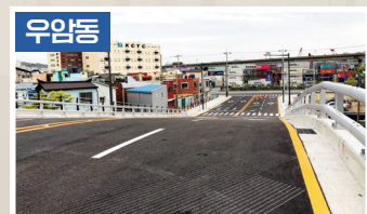
장고개 도로개통 2