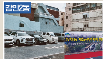
주거지 주차장 확보