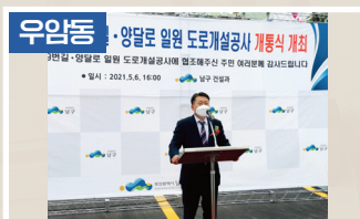
장고개 도로개통 1