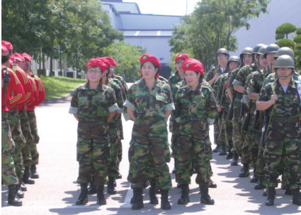
당진 여성예비군 창설, 국가안보의 첨병으로