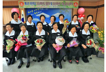
요람에서 무덤까지! 평생교육 만학의 꿈 해나루 시민학교(개교 2011년~)