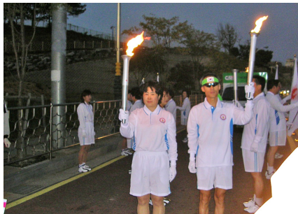
2006년 도민체전 성화 봉송 (엄마 순찰대 대표)