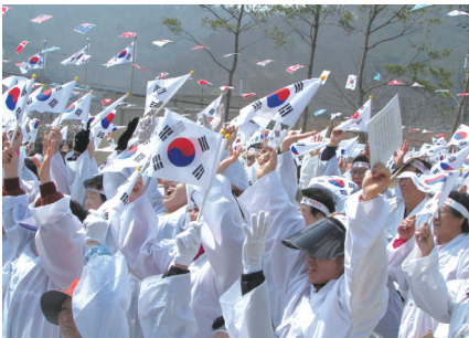
선열의 숭고한 정신과 희생을 생각하며! 대호지, 정미 4.4 독립 만세운동