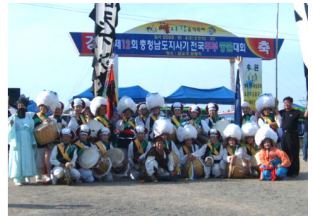
전국 주부 풍물대회 창설 (1997~ ) 전통문화 계승발전