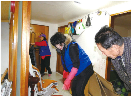
독거노인 접수리 봉사자로