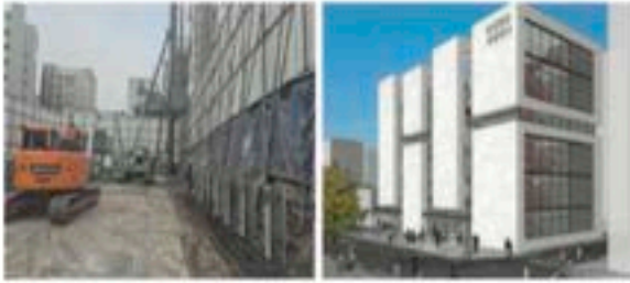
신림동 복합청사 신축 (진행중)