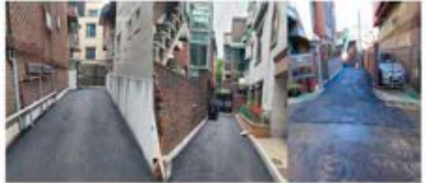
경사로 및 노후 골목길 도로포장