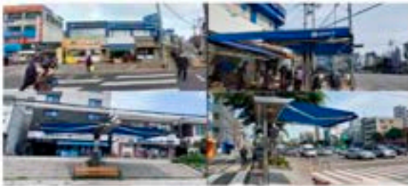
스마트 그늘막 설치