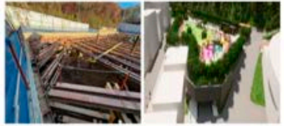
은천국사봉 공영주차장 건립(진행중)