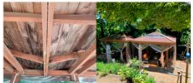
상도 근린공원 파고라 정비