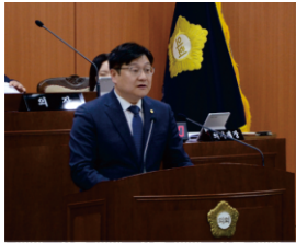
25년 찾아가는 소통