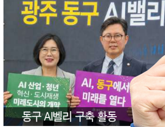
동구 시벨리 구축 활동