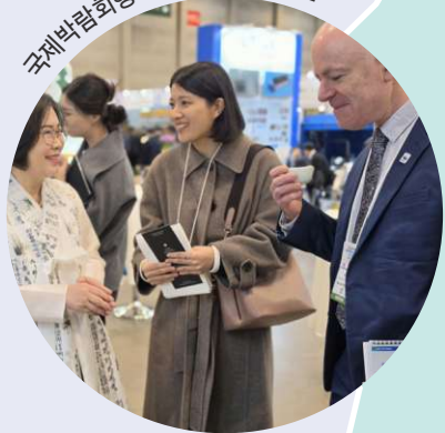
국제박람회행사 한국처문화 홍보