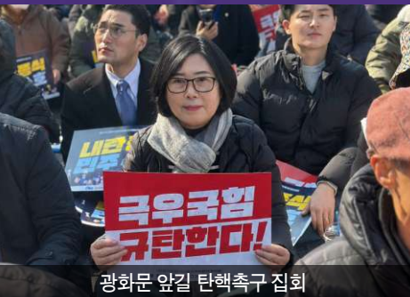
광화문 앞길 탄핵촉구 집회