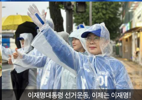
이재명대통령 선거운동, 이제는 이재명!