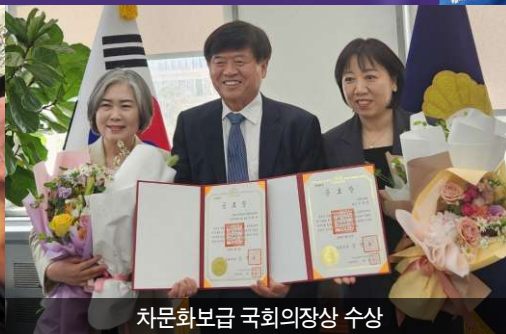
차문화보급 국회의장상 수상