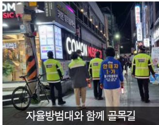
자율방범대와 함께 골목길