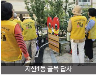
지산1동 골목 답사