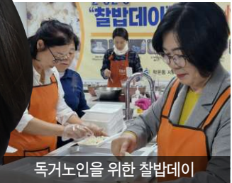
독거노인을 위한 찰밥데이