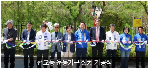
선교동 운동기구 설치 기공식