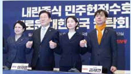
*내란중식 민주헌정수호 새로운 대한민국 원탁회의 출범식(25.2.19) 윤석열 탄핵 심판에 따른 조기 대선에서 국민의힘 재집권 저지를 위해 당시 5개 원내야당이 공동으로 출범