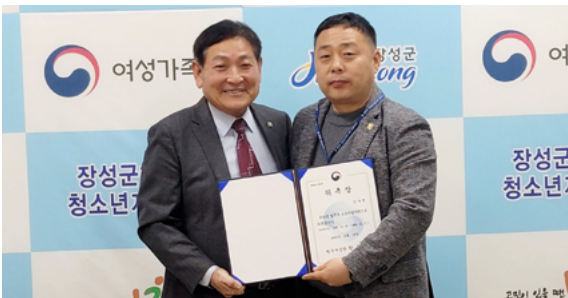
법무부 보호관찰위원회 위촉