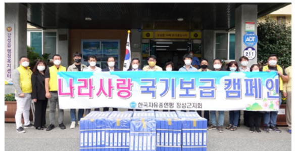
한국자유총연맹 나라사랑 국기보급 캠페인