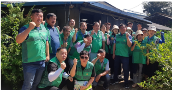
장성군새마을회 저소득 가구 집 고쳐주기