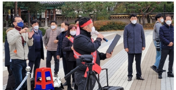
국립심뇌혈관센터 설립 촉구 결의문 낭독