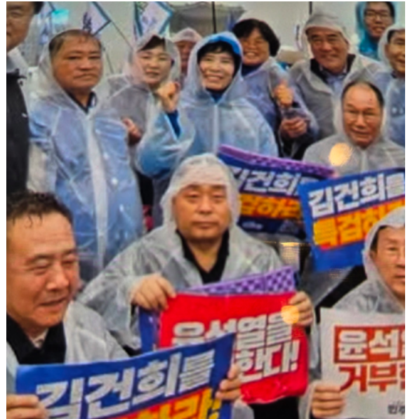
윤석열 탄핵집회 참가