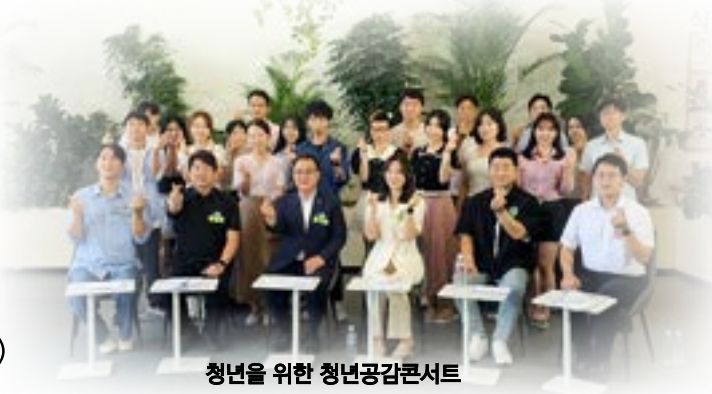
청년을 위한 청년공감콘서트