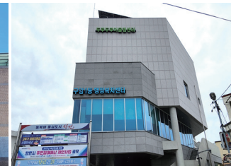
구암1동 행정복지센터 신축