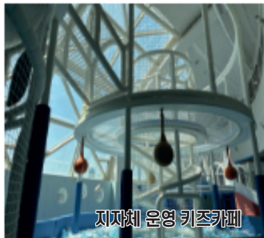
지자체 운영 키즈카페