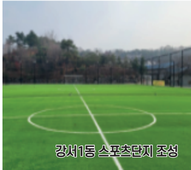
강서1동 스포츠단지 조성