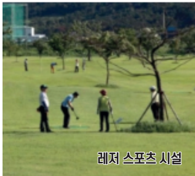
레저 스포츠 시설