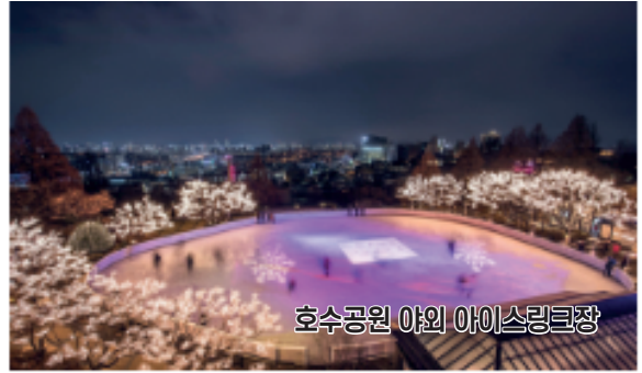
호수공원 야외 아이스링크장