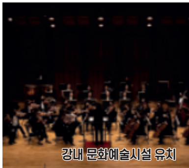
강내 문화예술시설 유치