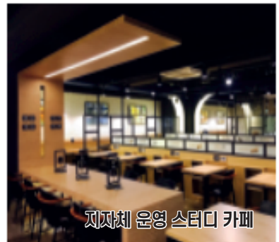
지자체 운영 스터디 카페