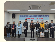
공공심야 어린이병원 주민발의지원조례 제정활동