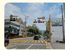
서해초 후문 과속카메라 설치