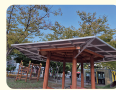
백련공원 정자 시설보강