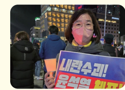
윤석열 탄핵 관련 활동