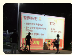
백련공원 실감형컨텐츠 조성