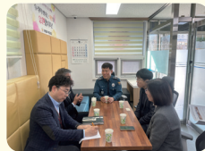
용당파출소 및 방범초소 이전 간담회