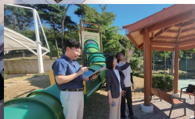
백련공원 정자 시설보강

연산동색동빌라 절개지 붕괴로 인한 주민불안 해소를 위해 도비를 확보해서 낙석망지망 설치