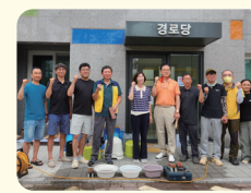
골드9차 아파트 칼같이봉사