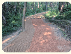
양을산 황토길 조성