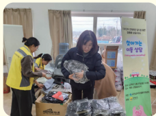
이주노동자 작업복 나눔