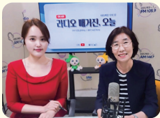
KBS1 목포 라디오 매거진 오늘 '의원이 간다' 출연