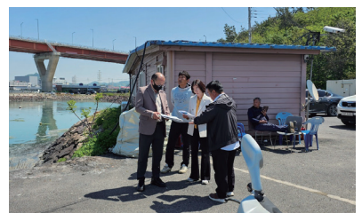
삽진항 준설 간담회