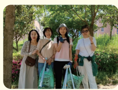
우리동네 줄기길 모임