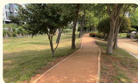
신안비치 팔레스 앞 황토길 조성