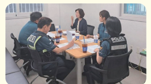
위험지구 CCTV설치를 위한 산정파출소 간담회