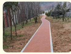
골드5차 아파트 뒷편 보행로 조성