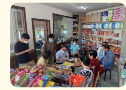
목과대 소방도로조성 간담회