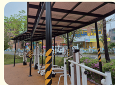
백련공원 체육시설 가림막