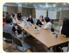
통학버스 민원관련 간담회