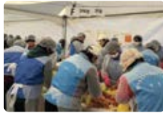
사랑의 김장 나눔 봉사