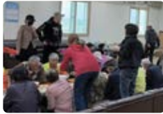
어르신 급식 및 돌봄 봉사