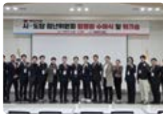
국민의힘 중앙 청년위원회 발대식