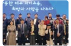
국제와이즈먼 제주지구 연말 나눔 행사