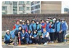
연동장애인지원협의회 꽃심기 봉사