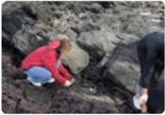
해양 환경정화 활동