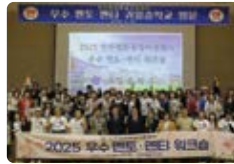
민주평통 제주지역회의 멘토 멘티 워크숍