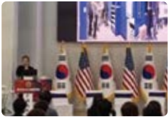
한-미 교류 및 토론회