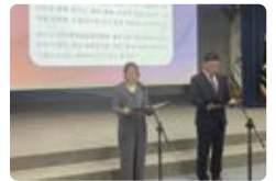
민주평통 제주지역회의 활동