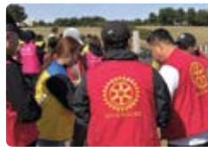
국제로터리 3662지구 나무심기 봉사