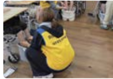
어르신 발마사지 봉사