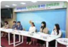
제주도 입양인식개선을 위한 정책토론회