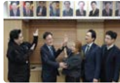
한중 청년 정책 간담회