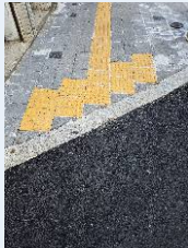
인도 및 차도 개선사업-3