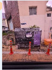
월산공원 진입로 경사지 염수살포기 설치-3