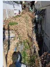
노후 다세대주택 옥벽붕괴 점검-3