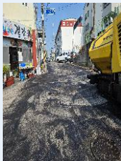
인도 및 차도 개선사업-7