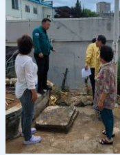
노후 다세대주택 옥벽붕괴 점검-2