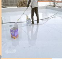
노후 아파트 옥상방수사업