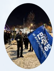
12.3내란 윤석열 탄핵집회