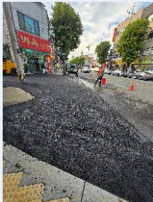
인도 및 차도 개선사업-1