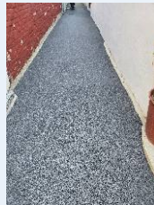
골목길도로 개선 후