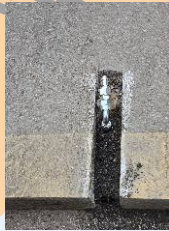
월산공원 진입로 경사지 염수살포기 설치-2