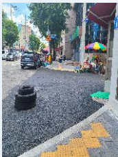
인도 및 차도 개선사업-5