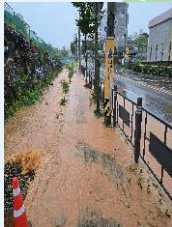
봉주초뒤 상습침수구역 저류지 설치사업