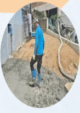
노후 다세대주택 옥벽보수공사-1