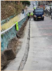
월산공원 진입로 경사지 염수살포기 설치-1