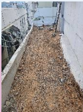
노후 다세대주택 옥벽보수공사-4