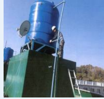
노후 아파트 옥상 물탱크교체사업