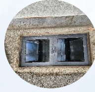
하수구 정비 후