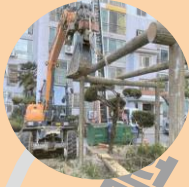
노후 아파트 우산각경비사업