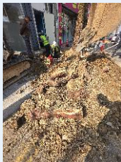
인도 및 차도 개선사업-8