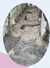
골목길도로 개선 전