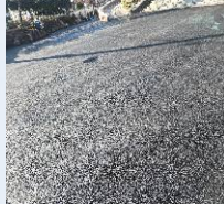
종교시설 및 공지골목주차문제해결-2