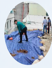
노후 다세대주택 옥벽붕괴 점검-1