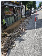
인도 및 차도 개선사업-6