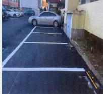
종교시설 및 공지골목주차문제해결-3