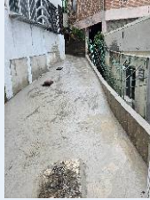
노후 다세대주택 옥벽보수공사-2