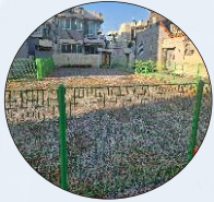
종교시설 및 공지골목주차문제해결-1