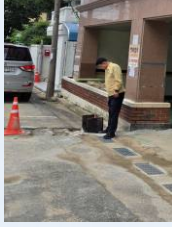
다세대주택 상습침수 해결 하수구 정비사업-2