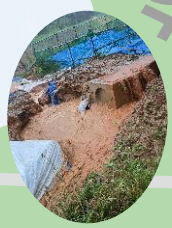
짚통산 배수로 문제점 해결