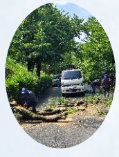
월산공원 산책로 정비사업