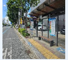
하수구 정비 전