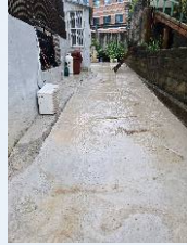
노후 다세대주택 옥벽보수공사-3