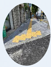
인도 및 차도 개선사업-4