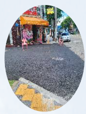
인도 및 차도 개선사업-2