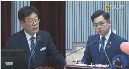
▲ 2019.8.27 이재명 경기도지사와 도정질문