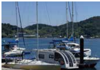
문화 | 복지 중심지역 프로젝트