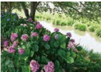
관광 | 지역경제 중심지역 프로젝트