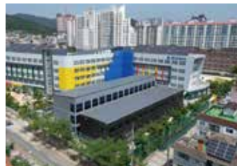
교육 | 중심지역 프로젝트