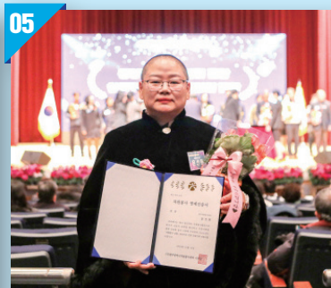
자원봉사 영예인증(금장) 수상 (2024)