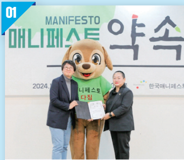
지방의원 매니페스트 약속대상 좋은 조례분야 최우수상 수상 (2024)