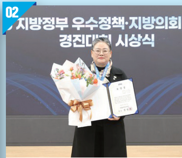
민주당 지방의회 우수조례 경진대회 최우수상-1급 포상 (2025)