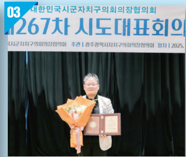
대한민국 시군자치구의회 의장협의회 대한민국 지방 의정봉사상 (2025)