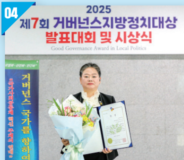
거버넌스 지방정치대상 우수상 수상 (2025)