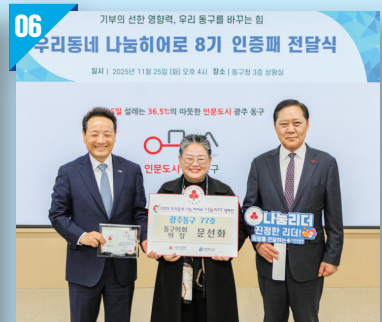
사랑의 열매 광주 동구 77호 나눔히어로 가입 (2025)